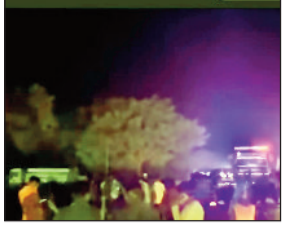
गुस्साए ग्रामीणों ने किया सड़क जाम, इलाके में तनाव का माहौल

जिले के लहुनिपाड़ा थाना क्षेत्र के बसुबहाल के पास बुधवार की शाम को हुए दर्दनाक सड़क हादसे में मृतकों की संख्या बढ़कर दो हो गई है। हादसे के बाद पूरे इलाके में तनाव फैल गया और आक्रोशित लोगों ने सड़क जाम कर विरोध प्रदर्शन किया।